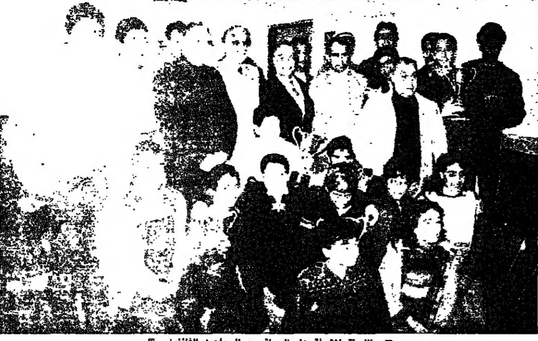
اللجنة المشرفة على السباق مع السباحين الفلازميين